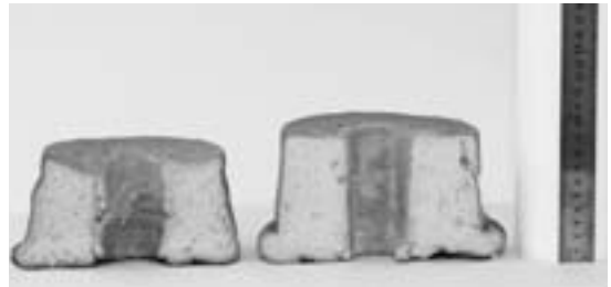
図1 シフォンケーキの切断面写真 (左: 米粉、右: 小麦粉)

焼成後重量は447.5gであり、重量変化率は83.1%であった。一方、小麦粉シフォンの加熱前重量は528.5g、焼成後重量は446.5g、重量変化率は84.5%であり、米粉シフォンの重量変化率の方が大きかった(表6)。先行研究と同様に、小麦粉シフォンは、生地調整時に材料の水分が小麦粉たんぱく質に結合し、網目構造が形成されてグルテンが形成されたため重量の変化が小さく、米粉シフォンの方は加えられた水分が吸収しにくいいため、焼成時に蒸発したと考えられる 10) 。