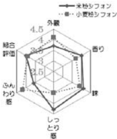
図2 5段階評価法による評価 (シフォンケーキ)

5段階評価法による官能評価の結果を図2、2点嗜好性試験法による評価を表8に示した。米粉を使用したシフォンケーキの得点は、外観3.7、香り4.0、味4.1、しっとり感4.3、ふんわり感3.6、総合評価4.0であった。小麦粉を使用したシフォンケーキでは、外観4.1、香り3.7、味3.9、しっとり感3.5、ふんわり感4.2、総合評価3.9であった。外観・ふんわり感は、小麦粉使用の方が米粉のものより得点が高く、香り・味・しっとり感については、米粉使用の方が高かった。いずれの項目において米粉シフォンと小麦粉シフォンを比較して有意な差が見られ、しっとり感では米粉シフォンの方が高く(p<0.001)、反対に、外観、ふ